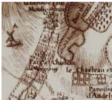
« Histoire de Margency », ouvrage 2003