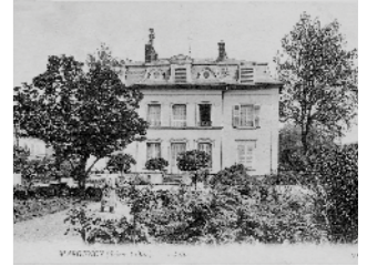
La Renaudière XVIII e siècle l