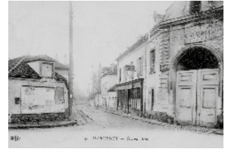
Auberge relais de Poste (1878 ?) k