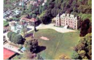
Domaine H.E.M de la Croix Rouge XVIII e siècle h