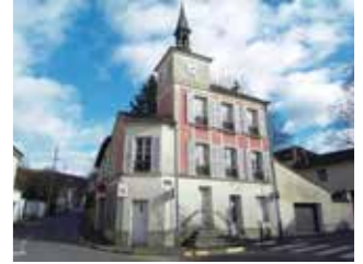
Ancienne mairie < 1837 j