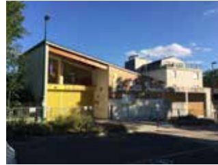
Maternelle le Petit Prince c