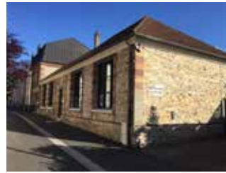
Bibliothèque - école 1873 ? a