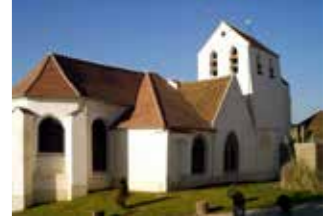
Eglise XV e siècle Ancienne chapelle i