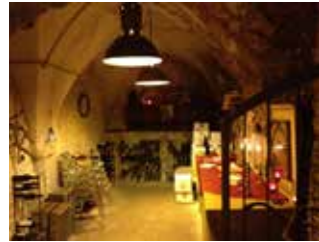
Cave Médiévale XIII e siècle e