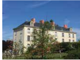
Maugarny XVIII e siècle b