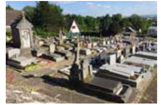
Lieu de mémoire cimetière (1823 ?) g

Les abeilles (ruches), Oiseaux, Hérissons, Ecureuils, Rongeurs, Insectes.