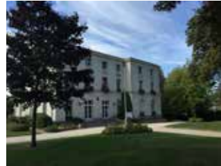
Mairie petit Bury XIX e siècle f