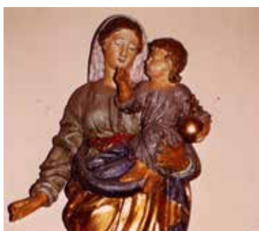
Vierge Polychrome XVIII e siècle

« Par les Arts, l'Écriture ils nous ont conté notre Histoire »