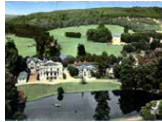
Domaine de Bury XVII e siècle d